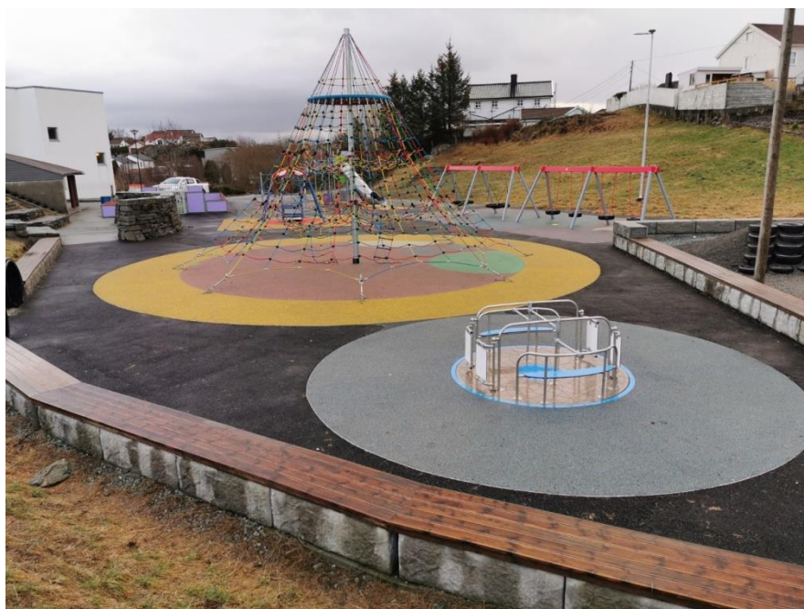
Bilde 4: Den nye skolegården på Kopervik skole

barneskole, Kopervik barneskole og Bygnes vitenbarnehage er oppgradert og har fått lekeapparater som er universelt utformet.