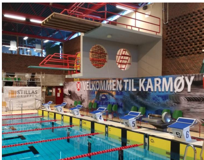
Bilde 2: Fra Karmøyhallen basseng

Barn og ungdom driver utstrakt uorganisert fysisk aktivitet både i barnehagene, skolene, i nærmiljøene, på idrettsanleggene og i forbindelse med friluftsliv.