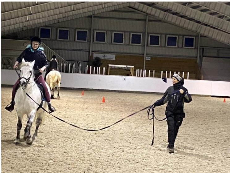
Bilde 6: Ridning hos Skudenes rytterklubb på Falnes

Utfordring å få til ridesti. Her er det vanskelig å finne å finne gode løsninger som ivaretar både hest, rytter, gående og syklende.