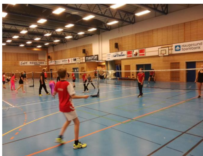
Bilde 1: Badmintontrening i Norheimshallen

Oppgangen viser at idretten har en stabil medlemsmasse i positiv utvikling. Se vedlegg 7.5. for oversikt over klubbene og aldersfordeling av medlemmene.