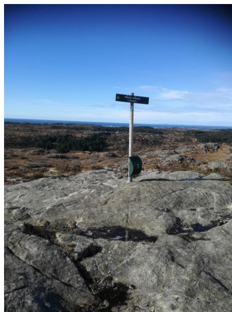
Bilde 3: Utsikt fra Nordre Sålefjell

Interessen for tilbudet er stadig økende, både med hensyn til antall registrerte brukere og registrert gjennomført turer i portalen.