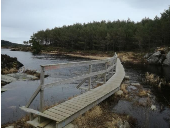
Bilde 5: Aureidvatnet

foreningene får dessuten et sterkere eier- og ansvarsforhold til anlegg og områder de selv har vært med på å utvikle.