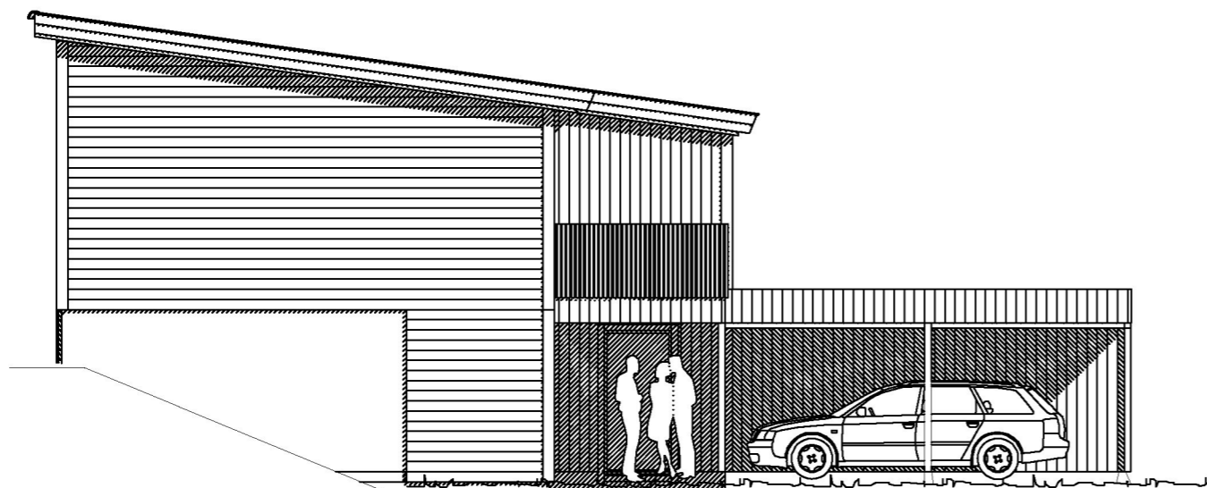
Fasade mot Nord vest