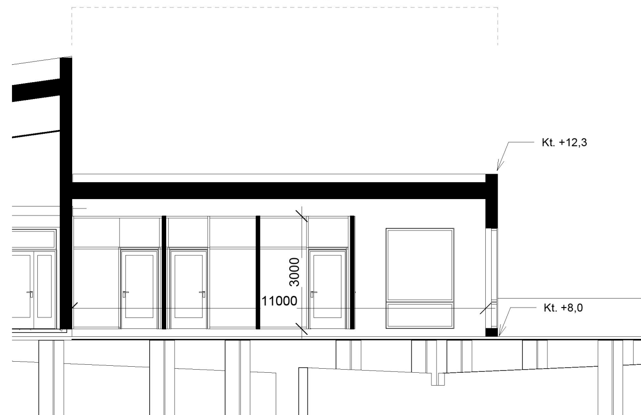
Snitt Tilbygg B-B 1 : 100