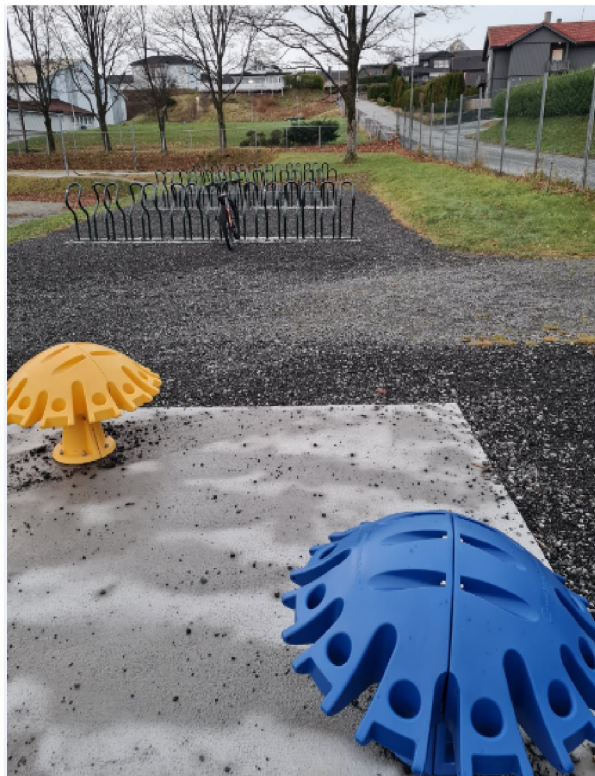
Sykkelparkering ved skolen ble også opparbeidet