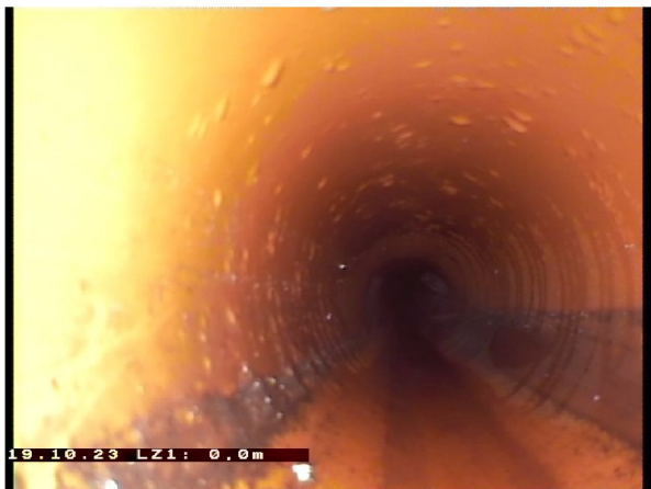
20.10.2023 145243_Endre_Grøft ved gjerde_19102023_072710_008.jpg, 00:00:00, 0.00m Start inspeksjon, 0%