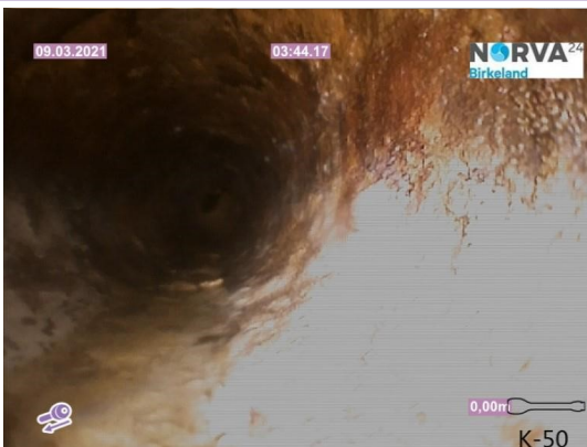
Spillvann_Inn til hus_Septik tank_20210309_134900.jpg