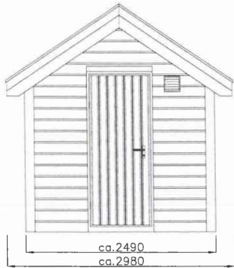
FASADE, GAVELVEGG - Dør