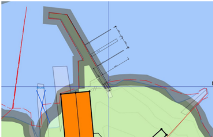
Figur 1) viser tiltaket (utriggere) inntegnet i eksisterende bølgebryter