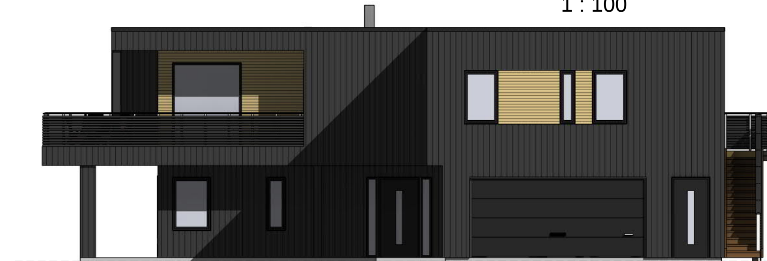
Sør 1 : 100