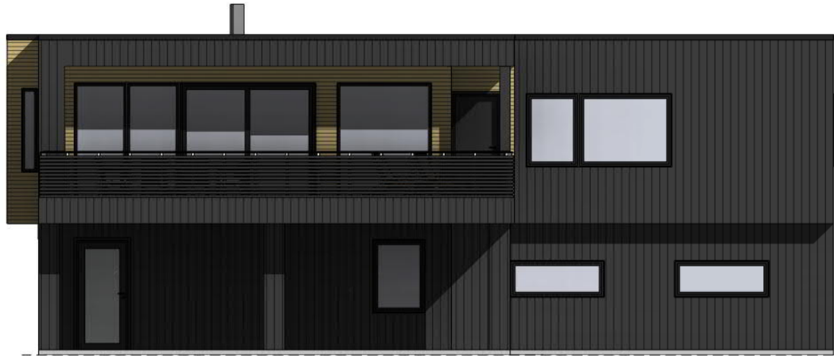
Vest 1 : 100