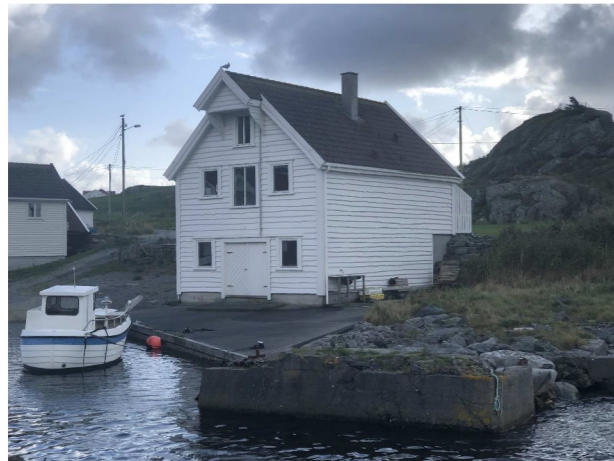
Eksisterende perspektiv mot nord-vest