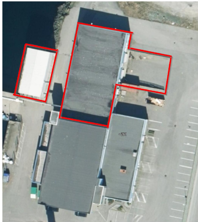
Bygningsmasse innenfor rød markering skal rives.

I rammesøknad ble det søkt om «rivning av deler av bygget», uten at det var spesifisert i hvilket omfang dette var. Gjennom detaljprosjektering av tiltaket er man kommet frem til at det er behov for å rive den nordre delen av dagens bygning, samt ishuset i vest.