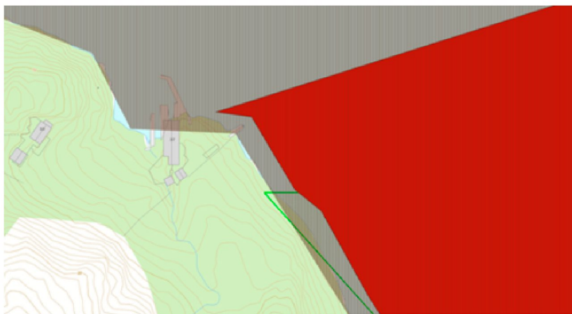
Figur 2) eksisterende bølgebryter vises midt i bildet, ålegrassamfunn markert i grønn farge nær land sør for tiltaket og låssettingsplass markert i rødt.

I vårt kartverktøy Yggdrasil (fiskeridir.no) er det i området søknaden gjelder registrert et regionalt viktig gytefelt for kysttorsk (feltet dekker hele Førresfjorden). Like sør for tiltaket, er det registrert et lite, men svært viktig ålegrassamfunn. Det er også registrert låssettingsplass for sild, makrell, sei og brisling like sør for tiltaket. Figur 2 illustrerer situasjonen i området.