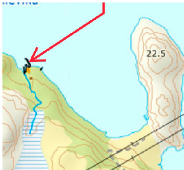
Oversiktskart, rød pil viser plassering