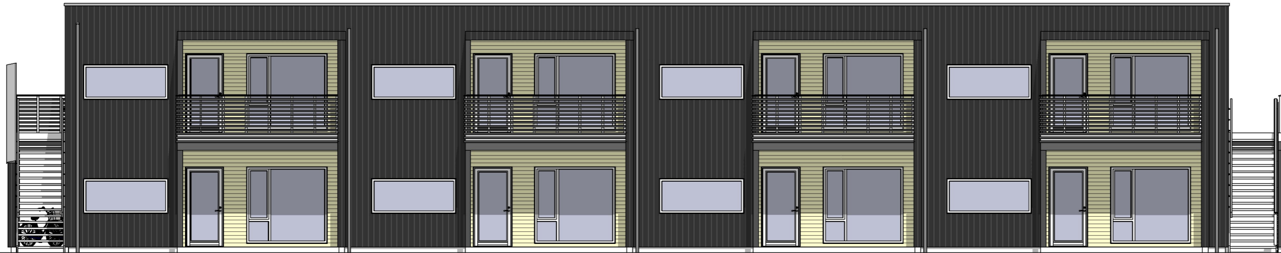
Fasade mot sør 1 : 100