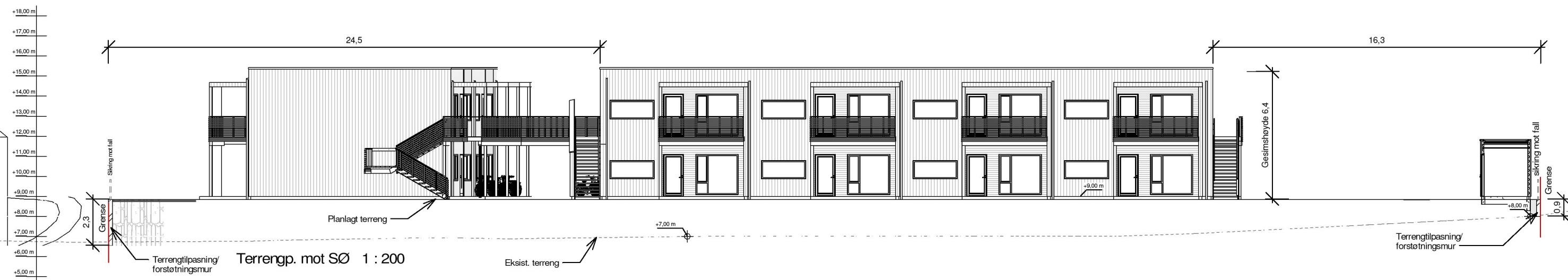
Terrenp. mot SØ 1 : 200