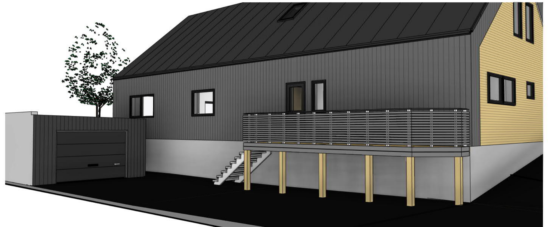
3D View 5

Snitt 4 A108 Eksisterende Mur Garasje 64/1356