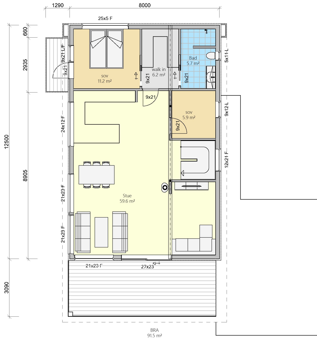
Plan 2 etg