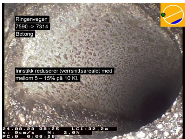
24.08.2023 080713_7314_7590_24082023_080913_008.jpg, 00:06:27, 32.20m Innstikk reduserer tverrsnittsarealet med mellom 5 – 15% på 10 Kl.