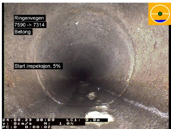
24.08.2023 080713_7314_7590_24082023_080913_002.jpg, 00:00:00, 0.00m Start inspeksjon, 5%