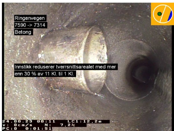
24.08.2023 080713_7314_7590_24082023_080913_004.jpg, 00:01:50, 12.20m Innstikk reduserer tverrsnittsarealet med mer enn 30 % av 11 KI. til 1 KI.