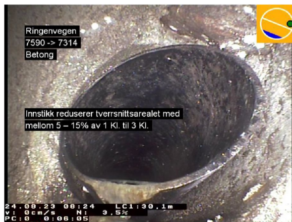
24.08.2023 080713_7314_7590_24082023_080913_007.jpg, 00:06:03, 30.10m Innstikk reduserer tverrsnittsarealet med mellom 5 – 15% av 1 Kl. til 3 Kl.