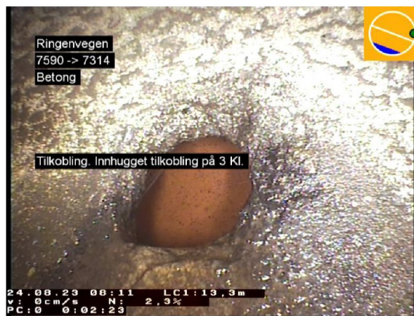
24.08.2023 080713_7314_7590_24082023_080913_005.jpg, 00:02:21, 13.30m Tilkobling. Innhugget tilkobling på 3 KI.