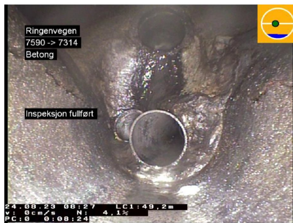
24.08.2023 080713_7314_7590_24082023_080913_009.jpg, 00:08:21, 49.20m Inspeksjon fullført