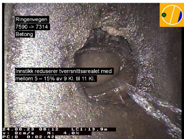
24.08.2023 080713_7314_7590_24082023_080913_006.jpg, 00:02:41, 13.90m Innstikk reduserer tverrsnittsarealet med mellom 5 – 15% av 9 Kl. til 11 Kl.