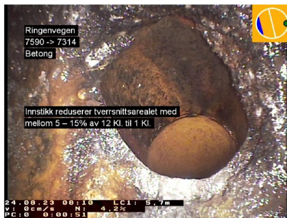
24.08.2023 080713_7314_7590_24082023_080913_003.jpg, 00:00:50, 5.70m Innstikk reduserer tverrsnittsarealet med mellom 5 – 15% av 12 KI. til 1 KI.