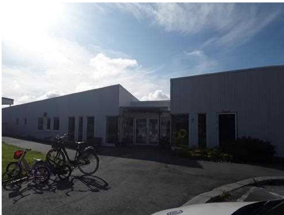
Dokumentasjon - [Fasade/objekt]