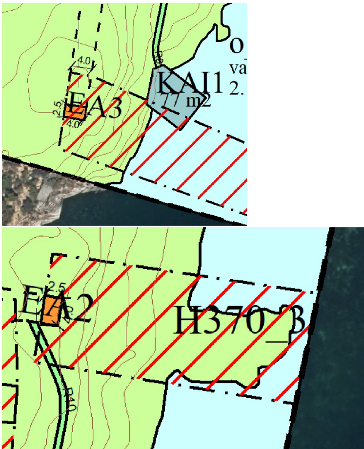
Figur 1: Kabelskap med faresone. Det er innenfor den røde skravuren at inngjerdingen kommer. Høydekotene er vist med brune streker og hver strek er en meter opp (meter over havet).

Det er vurdert at tiltakene som skal bygges ikke blir berørt av T-1442. En trafo skaper noe støy, men den vil ikke bli hørbar for de nærmeste naboene til tiltaket. Etablering av landstrøm vil også bidra til at skip i opplag vil støye mindre, enn de gjør i dag. Tidligere skip i opplag gikk på hjelpemotor, som går på marin diesel.