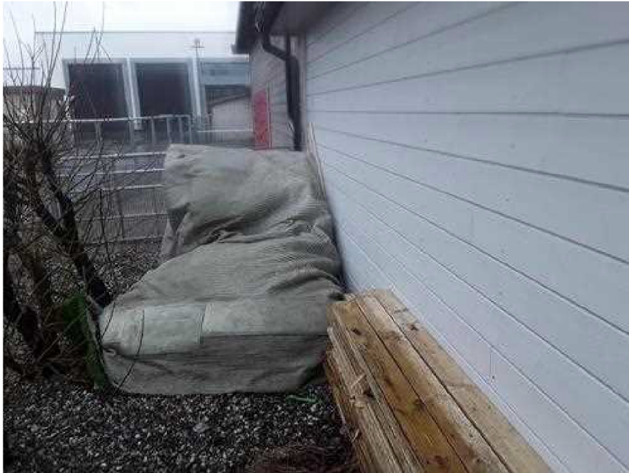
Andre kommentarer eller opplysninger til utført besøk - [Smart boks under kunstgresset]