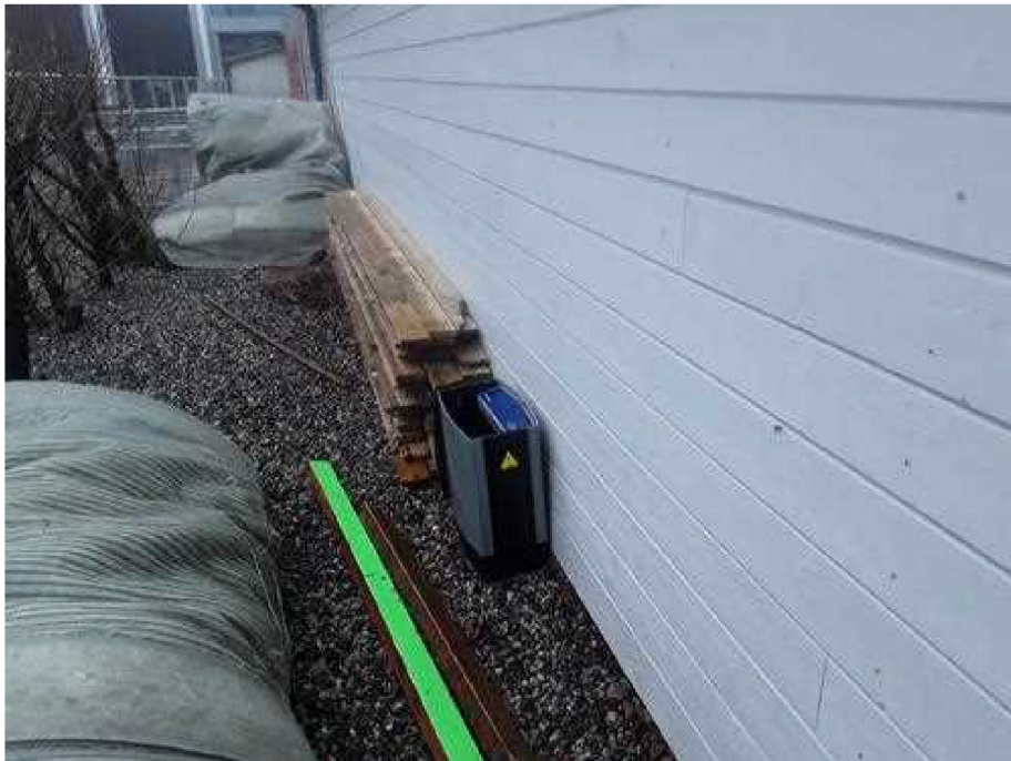
Andre kommentarer eller opplysninger til utført besøk - [reserve smartboks med 3 mus..]