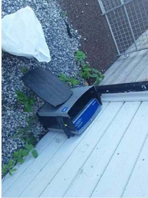
Dokumentasjon - [Dokumentasjon ]