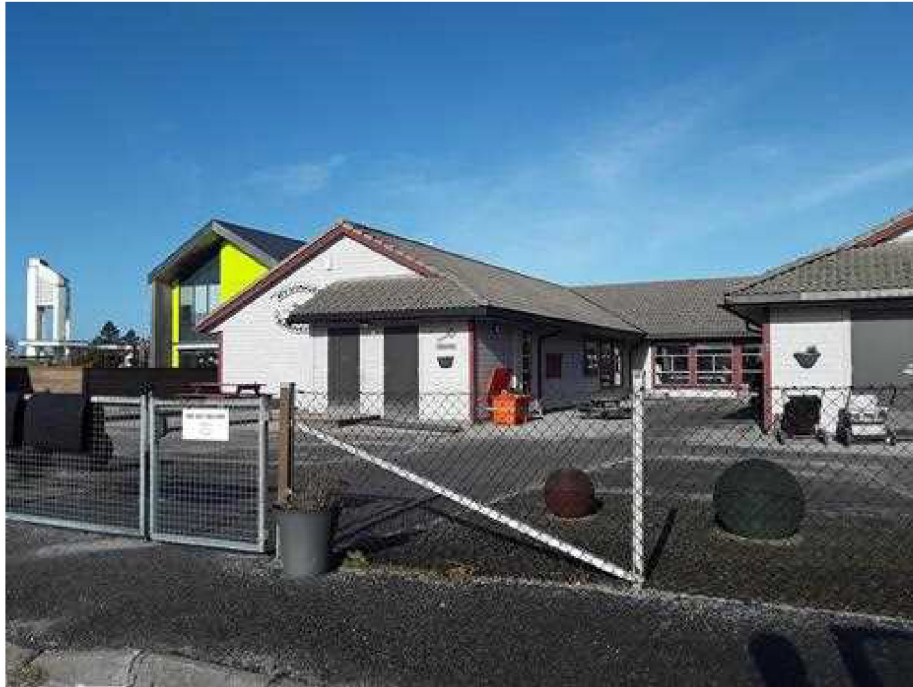
Dokumentasjon - [Fasade/objekt]