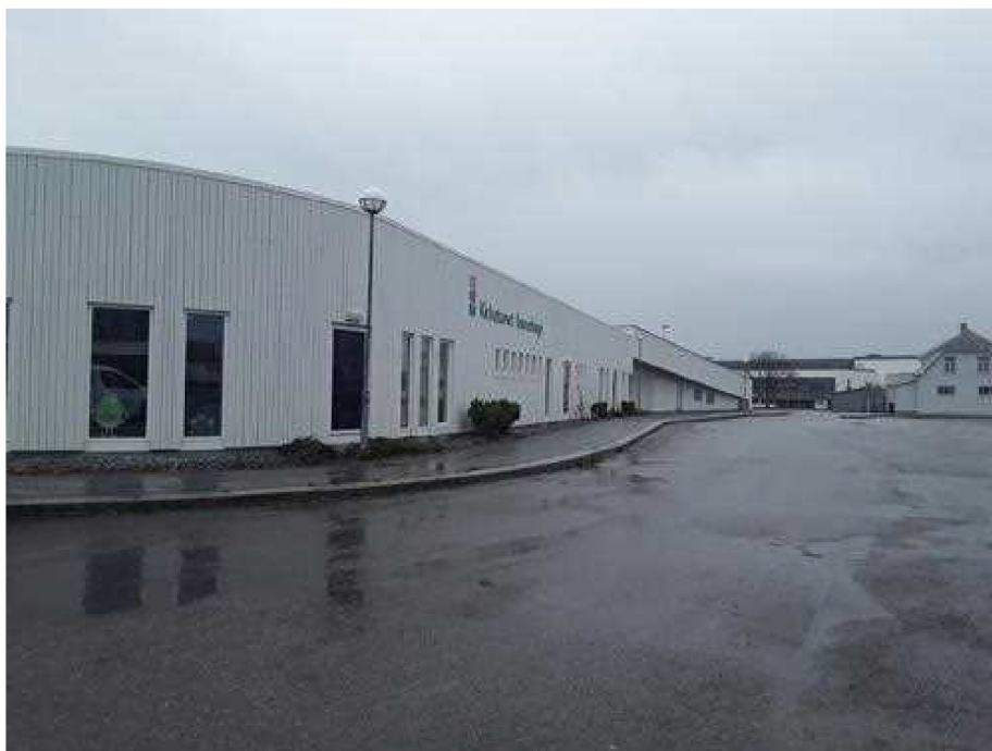
Dokumentasjon - [Fasade/objekt]