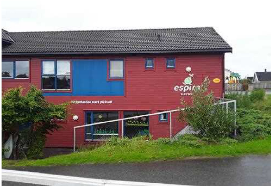
Dokumentasjon - [Fasade/objekt]