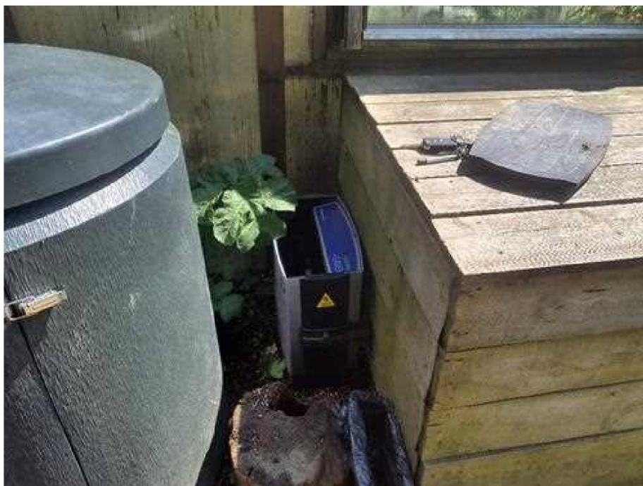
Dokumentasjon - [dokumentasjon]