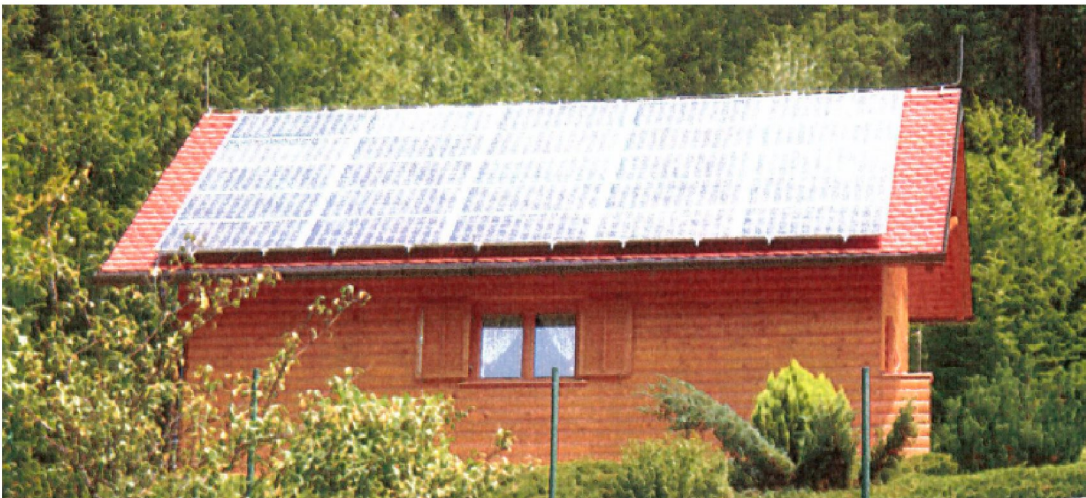
Illustrasjonsbilde av tilsvarende løsning som omsøkt.

Dette tiltaket krever ikke utstikking av plassering i plan og høyde.