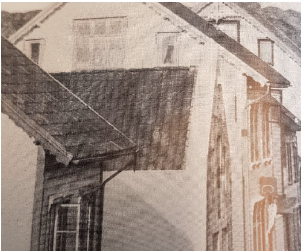
Eldre foto av Kaigata 6 og 12 som viser hvordan takrenner er montert

Utformes som kopi av de originale, kanskje finnes deler av disse fremdeles på bygningen? Eldre foto viser at vindskiene har hatt utskjæringer langs hele underkanten. Vindskien avsluttes vinkelrett på takflaten, ikke i lodd.