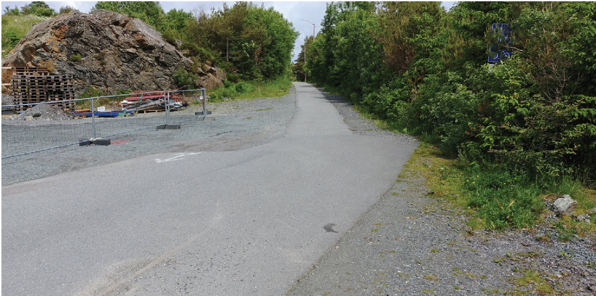
Fra enden av kjørbare Revurvegen der T3 (turvei) starter. Veien er delvis asfaltert, og med eksisterende belysning.

Vegetasjonen er sparsommelig foruten i noen dalsøkk der det er myrpartier og innslag av plantet/naturlig skog. Det er ikke registrert rødlistearter i området.