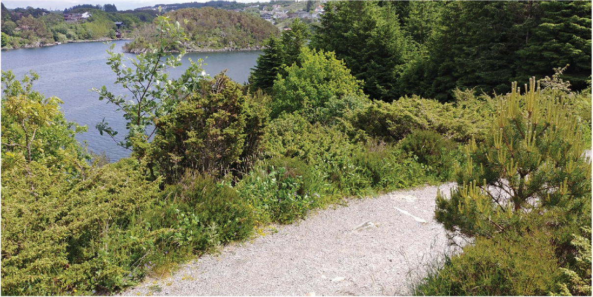
Parti fra dagens turvei, mellom de planlagte rasteplassene FRI10 og FRI11.