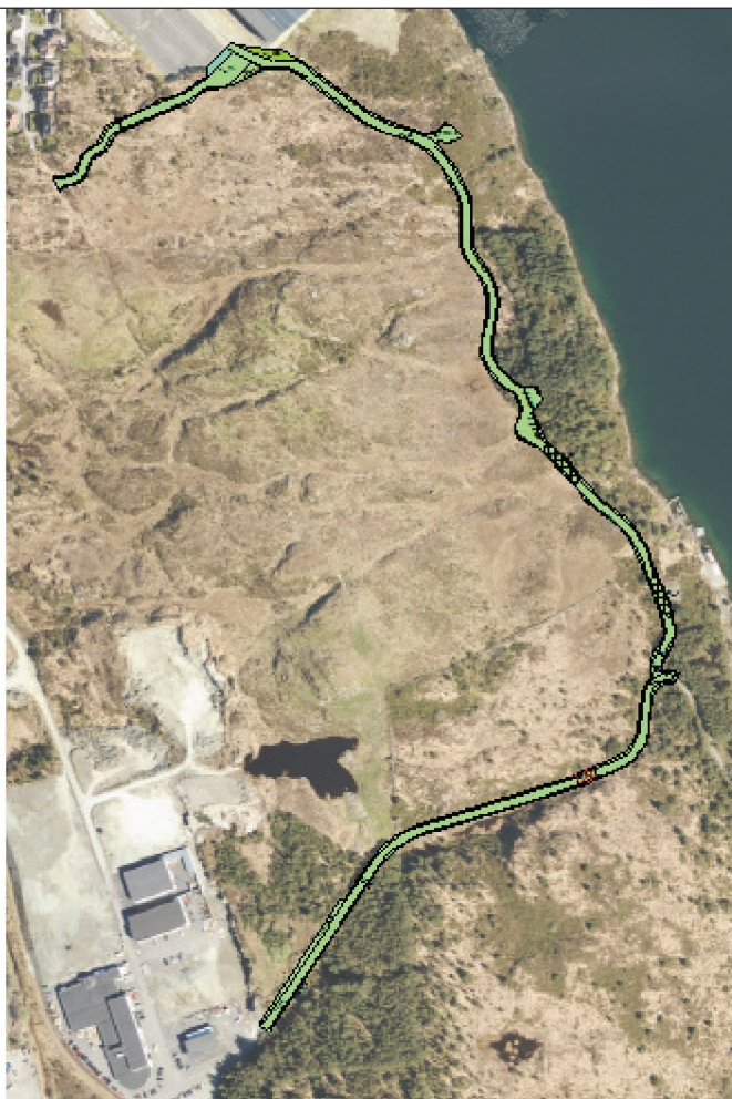
Planforslag 2103: Fra Veakrossen næringsområde i sør østover til Veavågen og videre nordover til Storhall Karmøy, med forbindelse vestover til regulert, ubebygd boligfelt på Veamy.