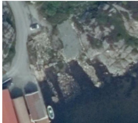
Flyfoto fra 2019