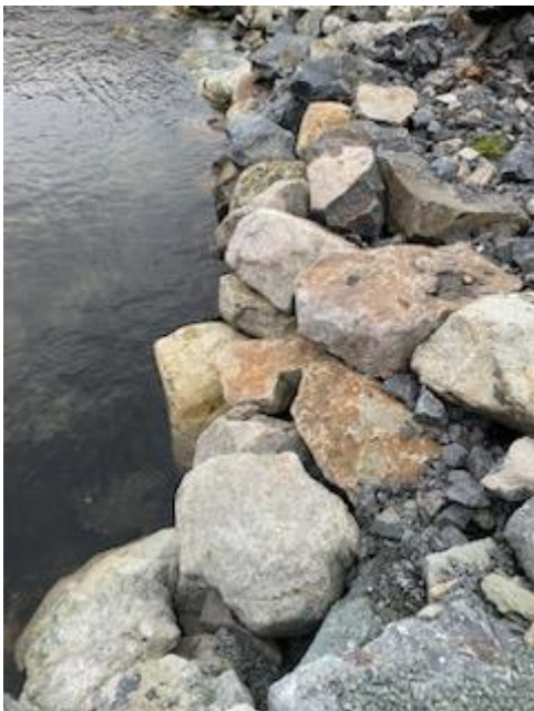
Foto over viser steinblokker som er lagt langs sjøkanten, over fyllingen som er utført i 2017.

Det meste av dette arbeidet ble utført i februar 2023 og nabo bruker fortsatt Gytri sin tomt som adkomst.