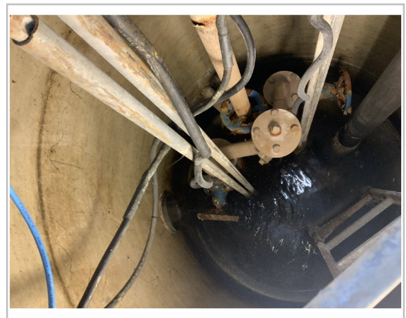
Stige ned i sump