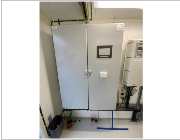
Sikringer henger ikke på plass