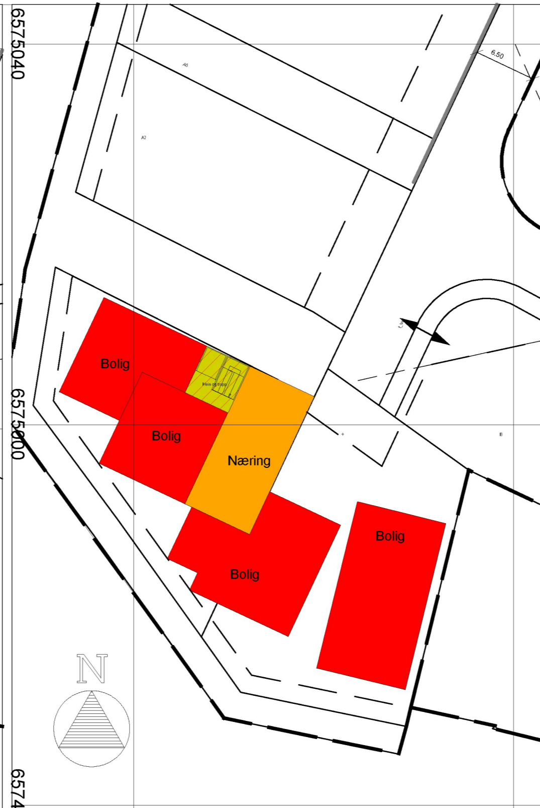
TRINN 2 - Etasje 3 - 1:400