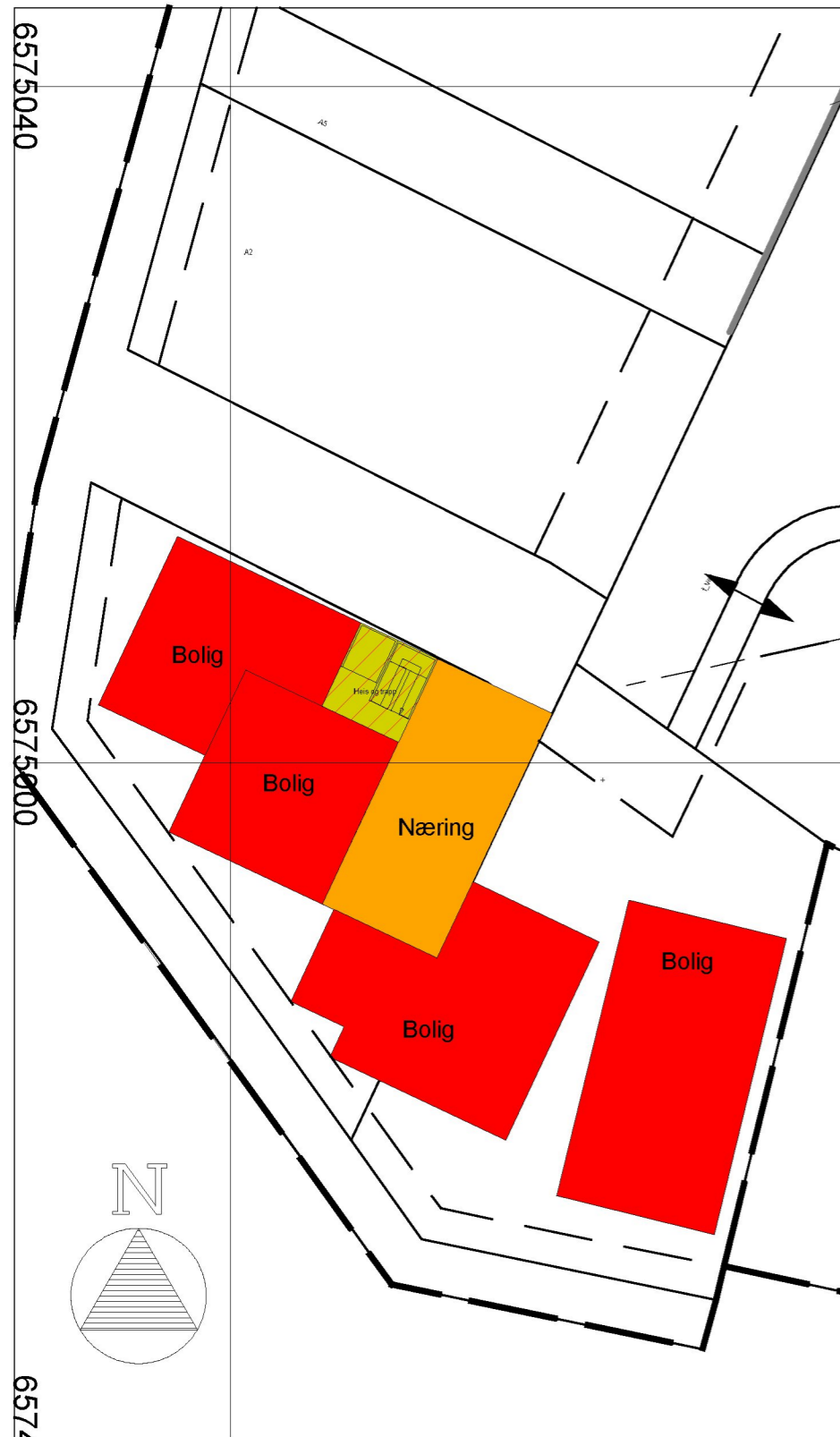
TRINN 2 - Etasje 2 - 1:400