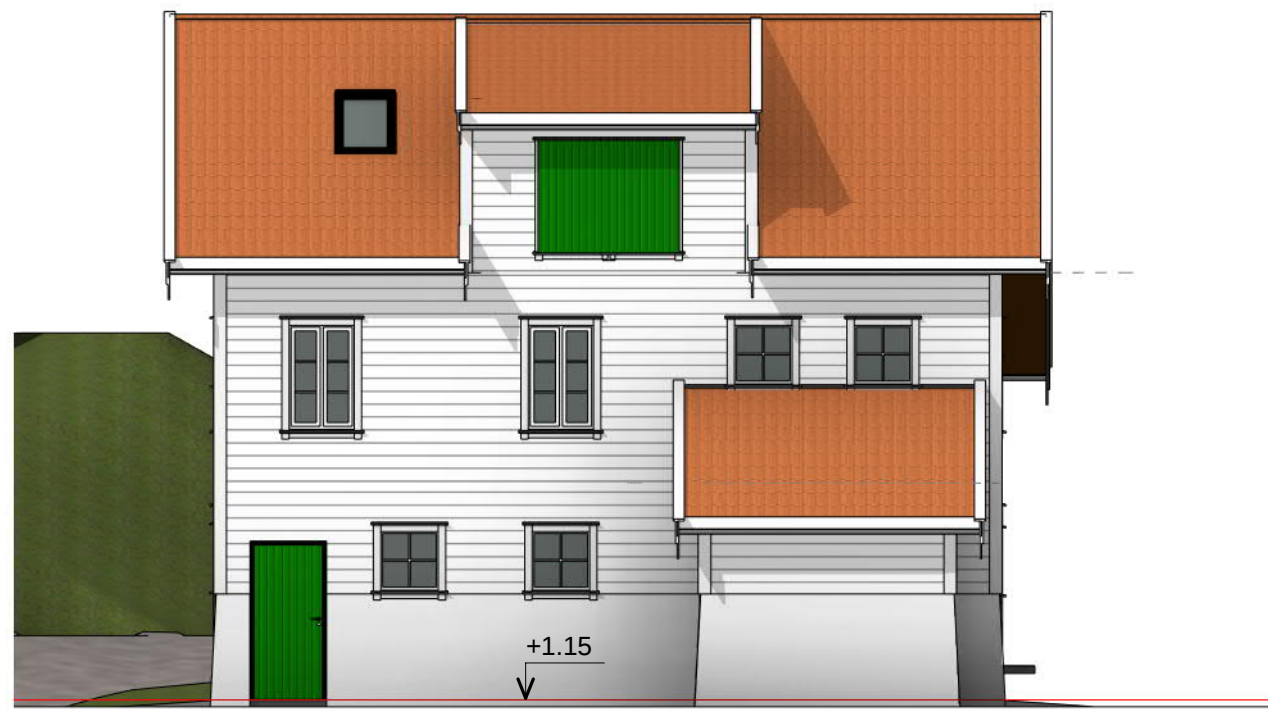
Nord 1 : 100