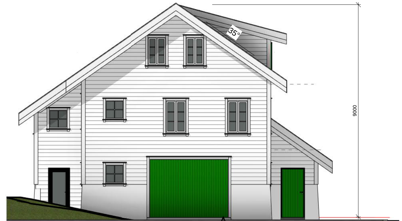
Øst 1 : 100