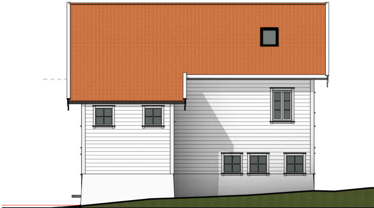
Sør 1 : 100