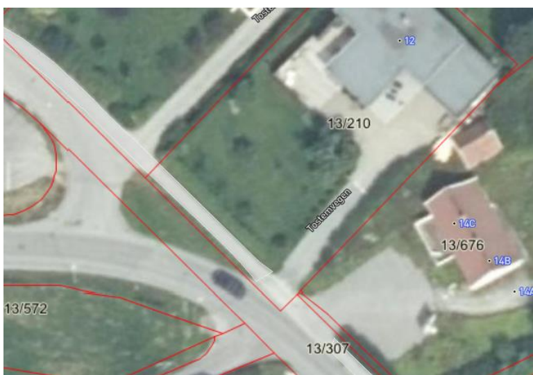
Ortofoto over området

Eiendommen gnr 13/210 har per i dag direkte avkjørsel til Tostemvegen. I plan 2109 er avkjørselen dreid mot nordvest, hvor den går over til felles avkjørsel med nabo. Fellesavkjørselen går ut i Tverrbekkevegen, som videre munner ut i Tostemvegen. Klager får med dette en lengre privat innkjørsel enn i dag, samtidig som det tar en del av hagen. I forhold til dagens opparbeidde situasjon, hvor fortau allerede er etablert på 13/210, går ca. 110 m 2 bort til ny innkjørsel.