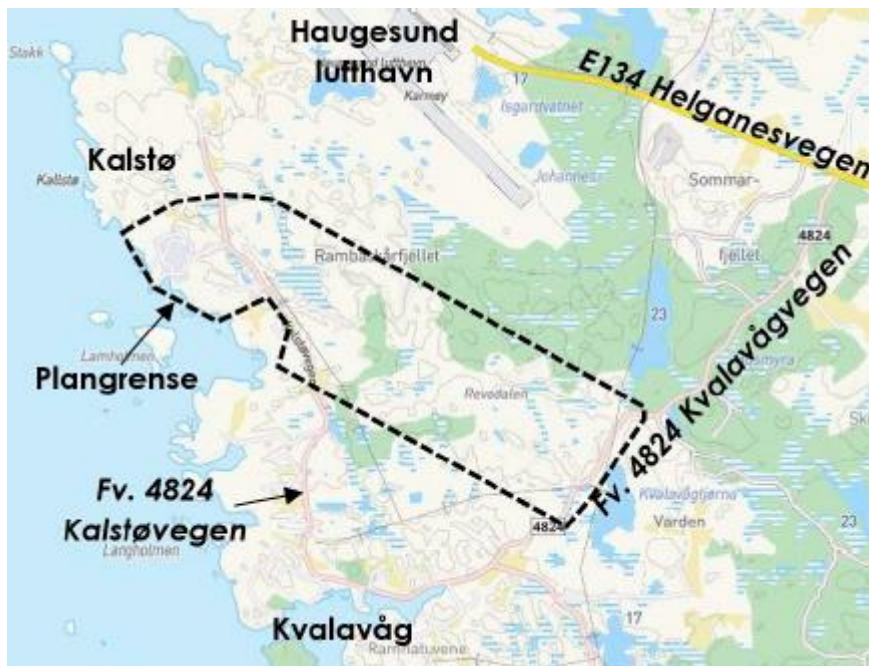
Utsnitt frå planbeskrivelse – plangrense