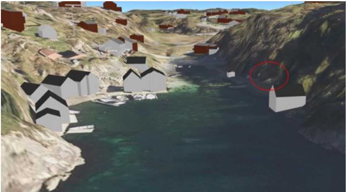
Plassering nytt naust er ringet inn.

Planbestemmelse § 28 endres slik at det er naustløsningen som har minst bebygd grunnflate som videreføres, et felles naust passer bedre inn med omkringliggende naustbebyggelse i området.