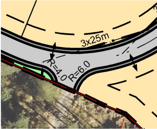
Krysset slik utformet ved offentlig ettersyn.

Som utsnitt fra plankartene under viser, så er krysset endret noe etter offentlig ettersyn for å legge veien mer i dagens føring, og slik at veien videre sørover mot gnr. 120/53 går mer rett fram.